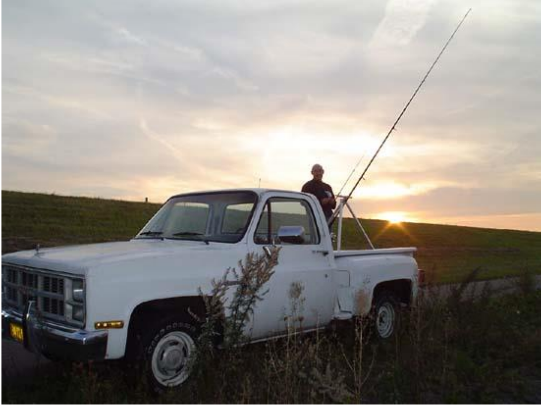
Vangzzzzzzze Erik #331

weer dat je die postzegeltjes op haakje 4 ving en dan ook nog die haak doorgeslikt hadden.