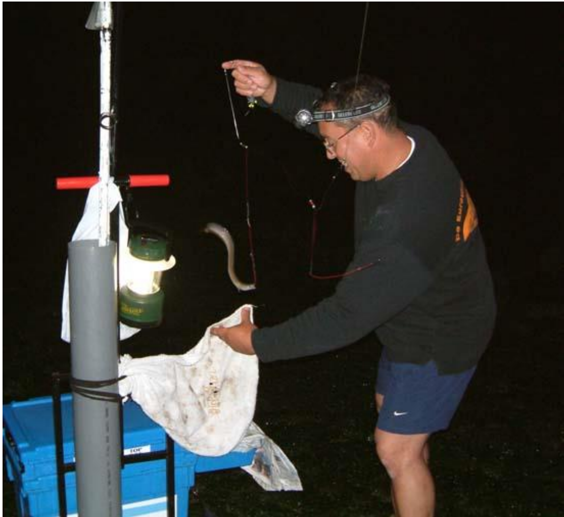
en voor mijn een botje gevolgd door een baarsje van 40cm .