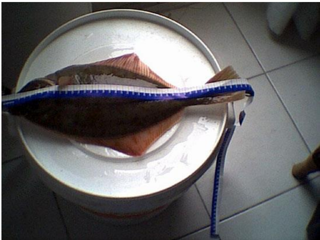
Gruuuute uuuuuut dat mooie Vluuuuuurdinge Leo 263#

Deze week niet zo veel te melden, na een paar keer in Vlaardingen gevist te hebben met als resultaat tussen de nodige steenbolken en wijtingen ,en een botje van (net geen record Tom )42 cm op 40 gram na een kilo ,zijn we D.D.A.in de Hoek wezen vissen, redelijk weer vangsten, diverse gulletjes botjes wijting en nog een zeebaars van -40 cm ,om rond 23.00 uur gestopt ,met zn alle naar huis door een drankfuiik van de politie (goed dat je er niet bij was Theo)hahahahahahhaahaa,iedereen mocht door rijden,zaterdag vol goede moet naar de Hoek ,voor de 8é competitiewedstrijd,daar is helemaal weinig over te vertellen,wind zand regen en anders om ook weer terug rond 20.00 uur afgeblazen,daarna met nog een paar euro's(vissers) wat aas opgemaakt in de waterweg,dat was helemaal niks,dus zondag maar weer eens in dat toch wel steeds mooier wordende Vluuuuuuuringe de rest van mn aas opgemaakt, en daar ving ik nog een mooie tong van 41 cm,die gaat morgen zo de pan in.nauw visvrienden dat was het voor deze week wel een beetje , misschien ga ik deze week een wedstrijdje van Avicentra mee vissen ,misschien tot aan de waterkant laterrrrrrr en allemaal vangszeeeeeeeeeeee