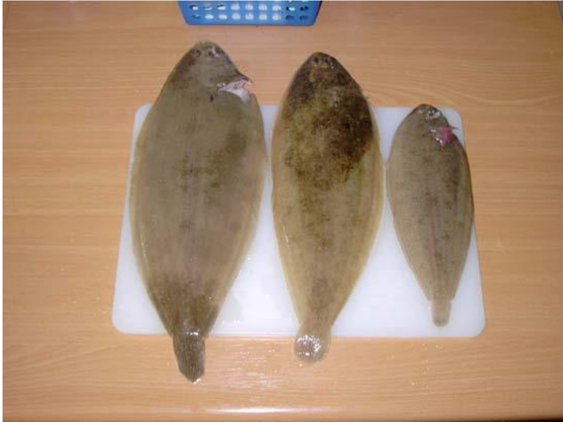
Goeten Stephan (#590)

vrijdag 9-7 naar de landtong gereden want het zou droog worden gedurende de avond en nacht(dus niet)dus toch maar een paar uur gevist.In de tussentijd kwamen Leo#163, Gilles die ook nog ff bleef vissen Martin#431 langs en gelijk ook kennis gemaakt met Stephan#590.Met de 5m stok weinig gevangen maar aan de picker was het een gekkenhuis waaronder 3 finten tegelijk aan slikkies.Over het algemeen allemaal klein waarvan 1 botje aan de 5m van 4cm aan een kweekzager.In 5 uurtjes ong.60 vissen gevangen en de meeste nog geen 20m uit de kant.