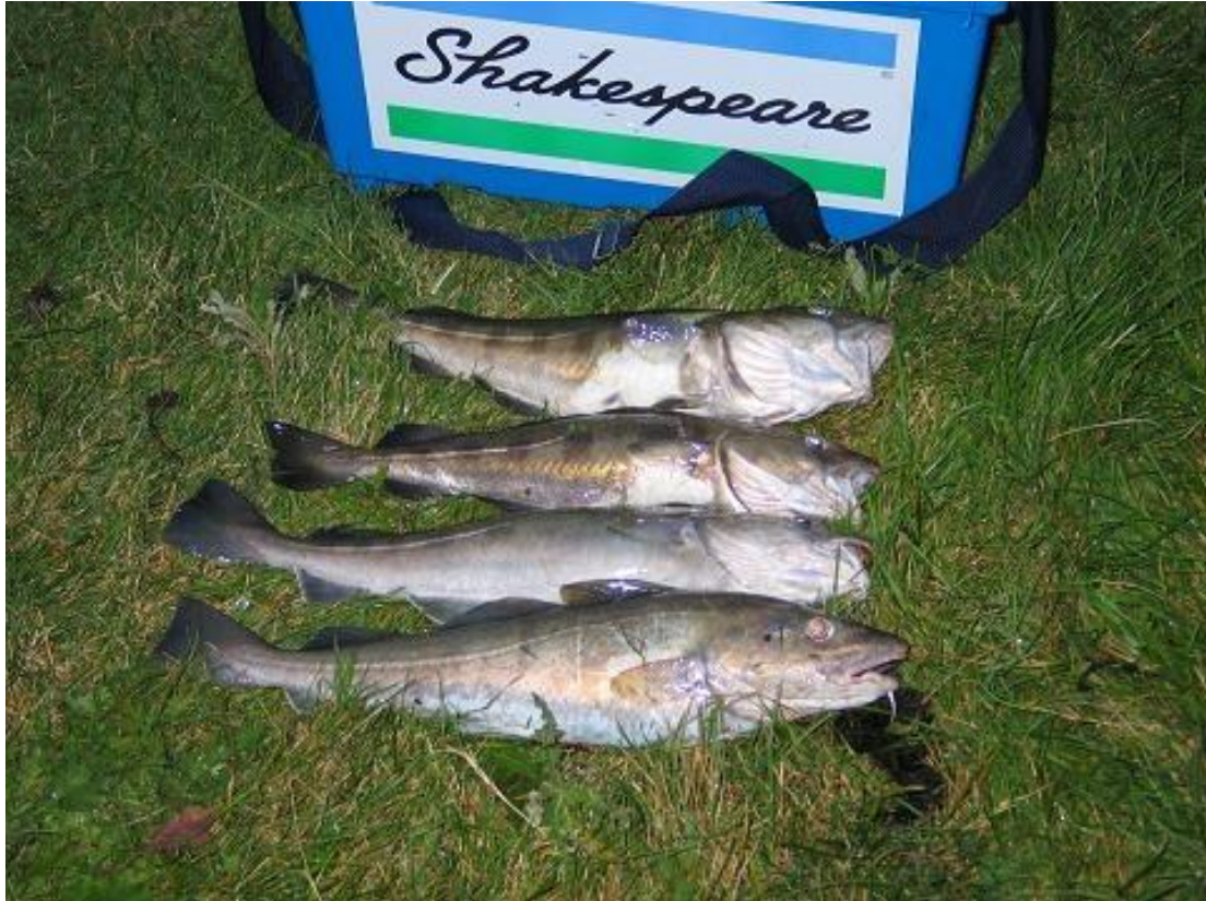
groeten, Bert #487

Zondag 3 oktober met de bellyboot op zeebaars gevist in het warme water van de centrale op de Maasvlakte. Door de nogal hoge zeegang gevist met de vliegenlat onder de blokken op het ondiepe gedeelte. De vangst bestond uit 4 ondermaatse baarzen, na een uurtje of 3 mijn arm uit de kom gegooid te hebben gestopt, de vissen vertoonden geen bijtlust meer.. Marcel weet wat mijn favoriete vlieg is, wat het nu net niet is, een Delta lure die perfect met de vliegenhengel te werpen en te vissen is. Op de weg naar de kant peddelend laat ik altijd mijn vliegenlijn( met deltalure) te water. Soms levert dat wel eens een bonusvis op. Een bot een baars een hoop vuil, of een tarbot zoals afgelopen zondag. Bij het binnendraaien van de lijn knalde er een meter of 15 van de waterlijn een heuse tarbot , de eerste van mijn leven op het kunstaas. Na een enerverende drill, wat is zo'n platvis sterk zeg, kon ik het beest landen. Helaas geen camera meegenomen in verband met de golven. Een volgende keer ga ik met zandspieringen en de werphengel erop uit om er gericht op te gaan vissen. Er kan gerust met een behoorlijk formaat spiering gevist worden want dit soort platvissen heeft een behoorlijk grootte muil.