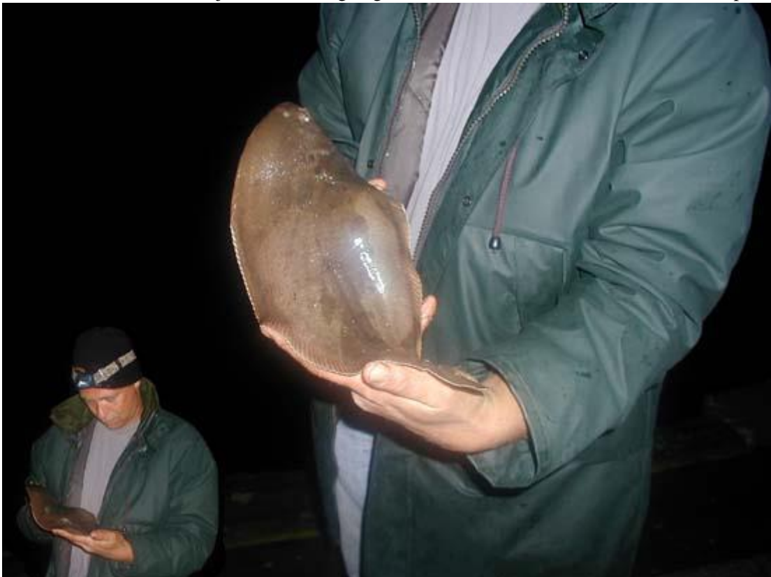
Het was een produktieve avond en het was wel heel lang geleden dat we zo lekker hebben staan vangen. De meeste vis werd aan de weegschaal gevangen en een enkeling aan de traditionele metalen afhouder. Om 2 uur vonden we het welletjes, de afgaande stroom werd behoorlijk sterk en ook het vuil was ook weer aanwezig, maar ons hoor je niet klagen. Gevist van 2 uur voor hoog tot 2 uur na met als