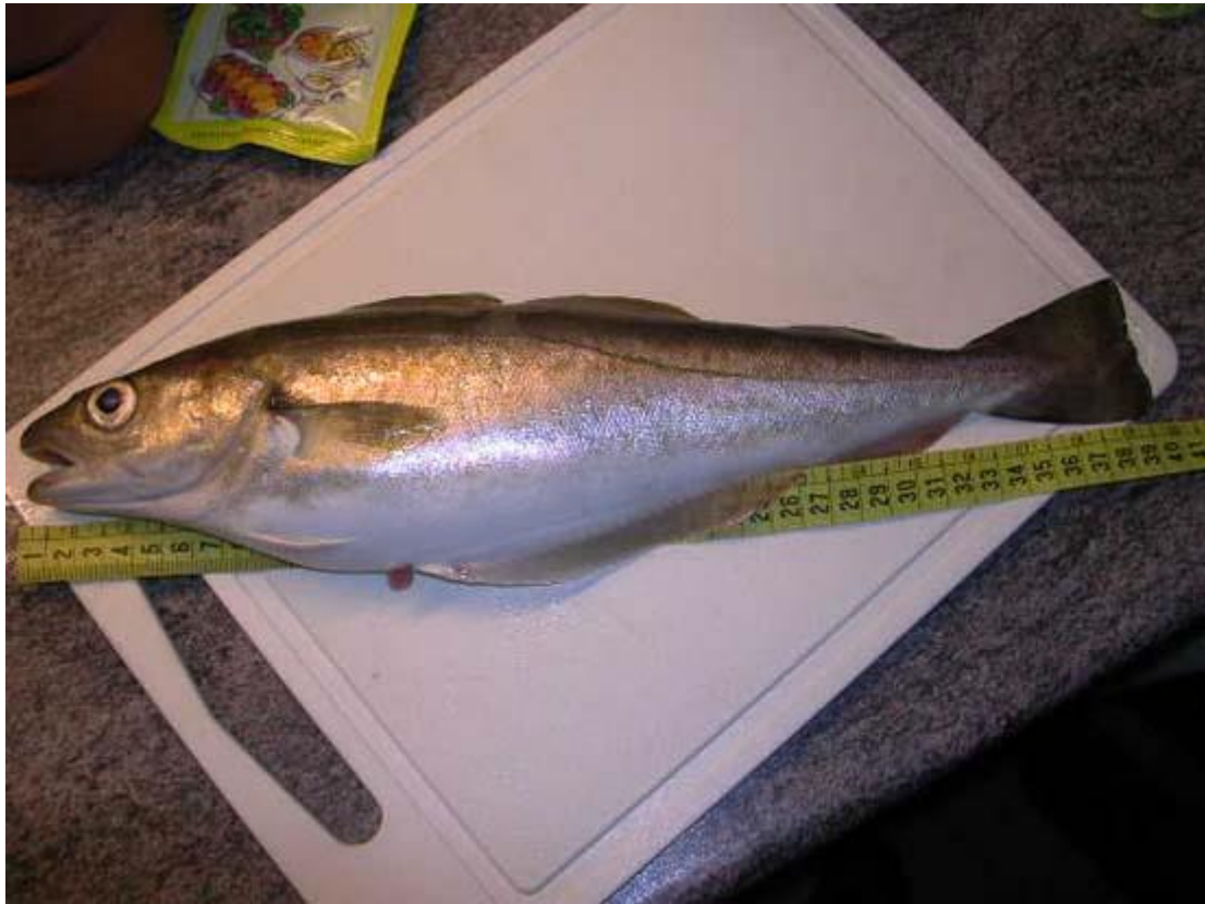
Groetjes Armel #230

zaterdagmiddag wezen vissen met andrew#311 op de pier van hoek van holland. ondanks de tegenvallende vangst konden we heerlijk pootje baden op de pier, waardoor we moesten verkassen richting baken. andrew had 1 gul van ong. 3 pond en een wijting met een halve bek..die weer zwemt ik zelf had 1 mooie wijting van een cm of 35 die weer vrolijk verder zwemt.