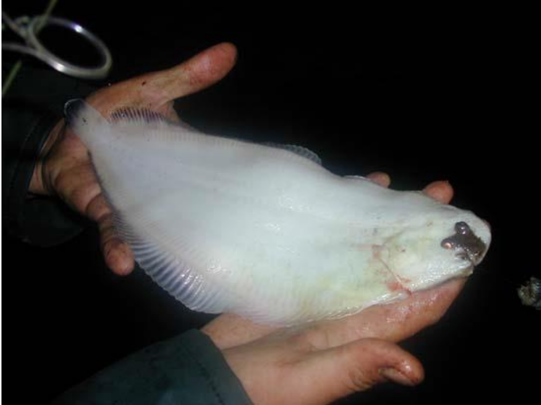
Het was een lekker visavondje en er kwam geregeld vis boven, waaronder zeer mooie exemplaren.