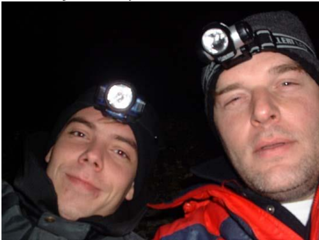
ron#467 en alex#528

goed en vooral visrijk 2005 vanuit het mooie westervoort.