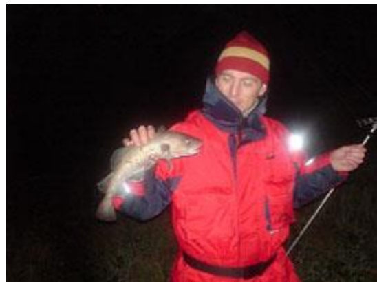
Maui en Rene