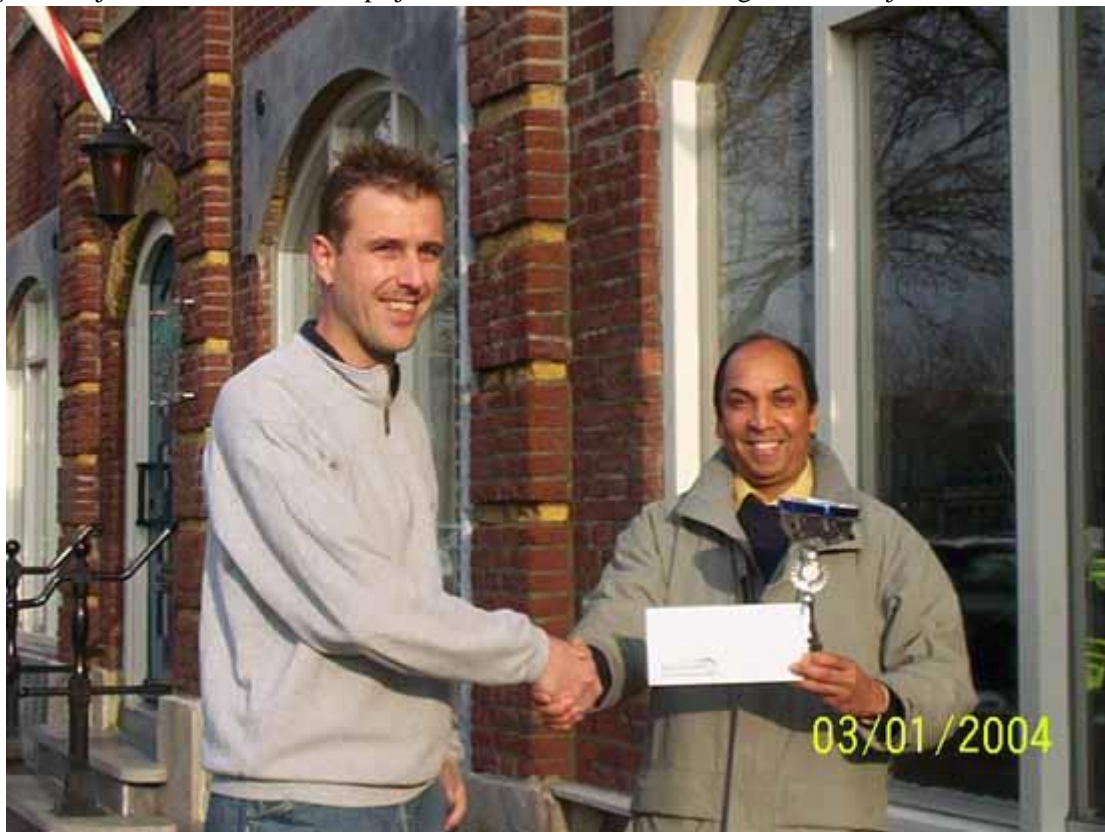
hij heeft een cadeaubon van 200 euro. IT'S ALL IN THE FAMILY!!! Jammer dat er zo weinig Eurovissers aan de competitie hebben meegedaan, ik hoop dat er een andere Eurovisser dit jaar met de eer mag strijken. Stipo en Leon, zijn een hoop doekoe's hoor, hihi!!