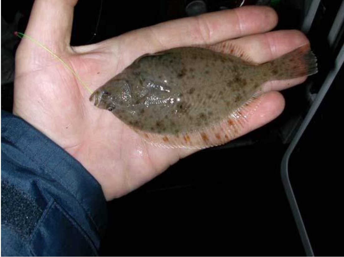
Slappe lijnen Willem # 32

inlegkruissie. Let vooral op het formaat van de vis op de foto, dit word de trend bij de wedstrijden.