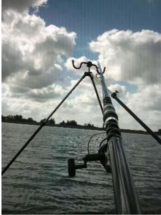
Groeten van het V-TEAM.

Zondag 26-09-2004 weer in de waterweg wezen vissen van 10.00 uur tot 17.00 uur de hele dag wel lekker staan vangen 9 gullen tussen de 40 en 50 cm aan de kant en 1 verspeelt tussen de blokken en 4 bolkje mijn vader 3 gullen ook rond de 45 cm en 2 bolkje de bolkje zwemmen weer (voor zover ze het over leven) voor mij staat de teller met vorige week zaterdag alweer op 11