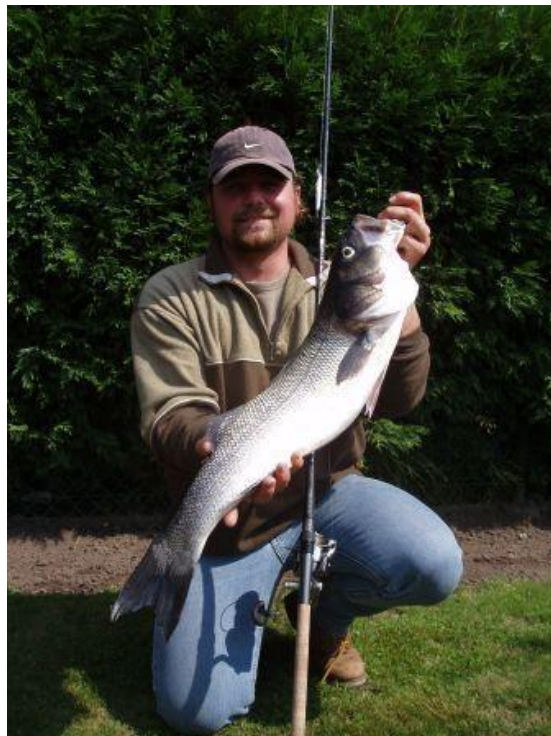
Groeten van de Zotten uit Beerse