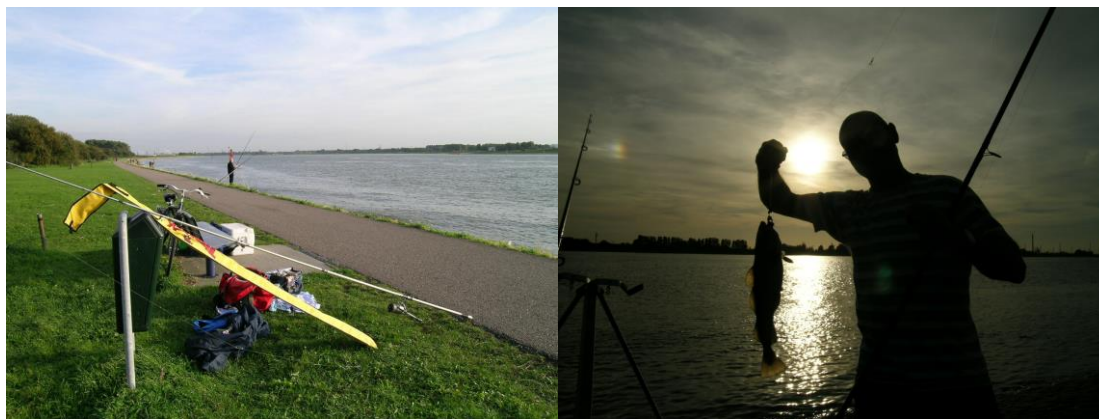
Groeten en krakend Karbon