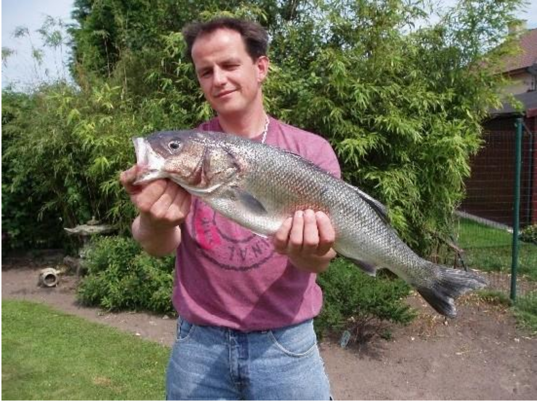
groetkes van de zotten uit....idd

Bij mij ging het allemaal weer wat minder maar.....het seizoen duurt nog lang !!!!!