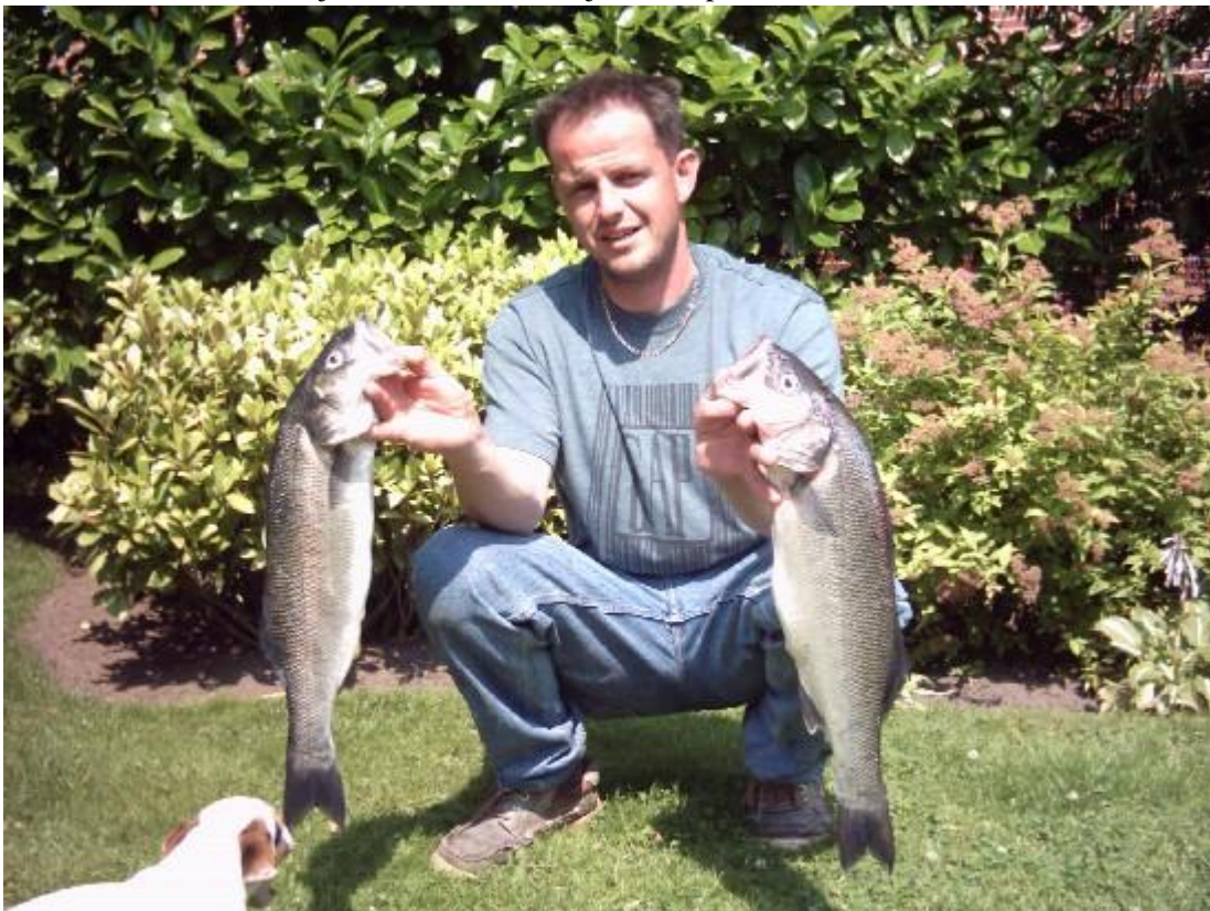
Groeten van de Zotten uit Beerse

Paar stekken aangedaan in Zee(baars)land en hier en daar een mooie baars verschalkt met de plug en ook enkele met een werppilkertje. 10 Baarzen hebben zich laten foppen door de Zotten , en enkele daarvan zullen weer heerlijk smaken ..... Ruudje weer op de foto met het mooiste duo ( +/- 60cm ) .