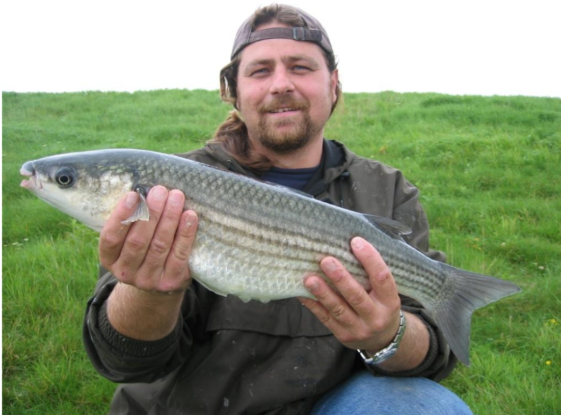
groeten van de Zotten, Beerse