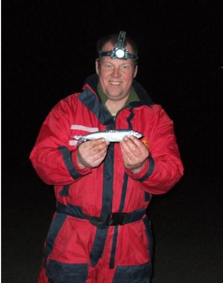
Gr Ricardo #119.

Donderdag 9 februari met storm en winterse buien richting Maasvlakte gereden. Een aantal stekken viel af vanwege de NW-wind op de kop en uiteindelijk een mooi plekje met diep water uit de wind gevonden. Rond 16.30 begonnen, nog licht, en geen stootje gezien. Rond de schemering ging gelukkig het fluitje en kwam de rondvis in grote getale op het aas af. Doubletten en tripletten wijtinkjes, met af en toe een mooie bolk en zelfs een gulletje. Helaas geen grote vis, meeste wijting was rond de 25 cm. De vis had rond de schemering een duidelijke voorkeur voor slikken, maar later maakte het niks meer uit. Op de feeder ook nog de nodige botjes gevangen.