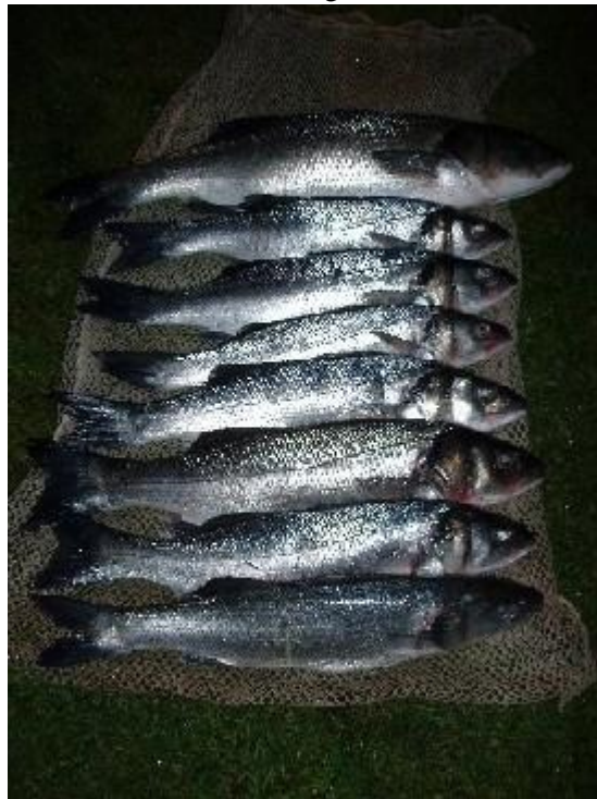
Groeten van de zotten van Beerse