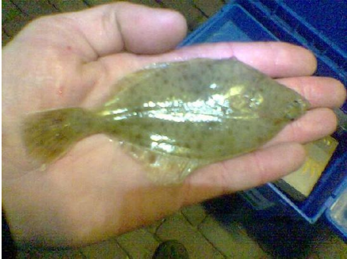
Groetjes John #646.

Zondagmorgen( lang weekend 1 mei) eerste gepen pakken....tenminste dat is een beetje traditie voor de Zotten gedurende een 10 tal jaar. Maar..... loodgrijs water, zware bewolking, temp.6°C, druilerige regen: tja.... met zulk weer kan zelfs een kweekzagerdje op haakje 6 aan een 2.5 meter lange 18.00 onderlijn onder een 20 grams Stabilo dobertje geen geep verleiden ..... na 3 worpen wisten we genoeg.... ze waren er simpelweg nog niet !!!!! Dit hebben we nog nooit meegemaakt .