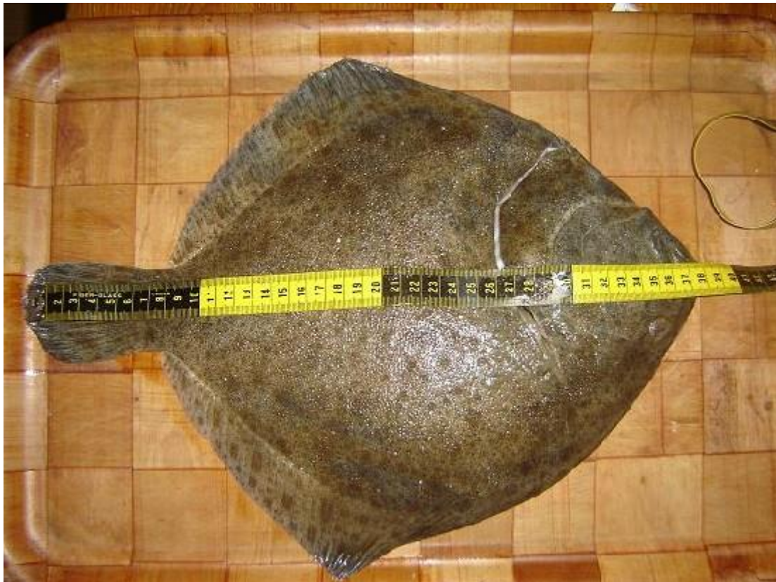
Richard van der Haven # 790