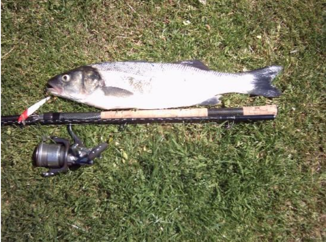
Groeten van de Zotten van Beerse.