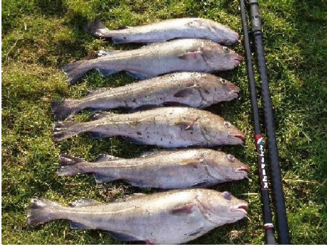
Groeten van de Zotten, Beerse

Zaterdagavond 07-01 samen met Arvy het aas opgemaakt dat over was van vrijdag. Aangekomen om ca 20:00 uur bleek dat de stek al druk bezet was. We zijn een stukje verder gaan staan alwaar het gelijk een stuk minder diep is. Over de vangst kan ik kort zijn 0,0. Slecht een paar tikken gezien maar niks kunnen verzilveren. Tussendoor nog even bij de andere vissers gaan kijken en kennis gemaakt met Willem en Hans. Ook hier was het niks. We zijn om 22:30 uur weer naar huis gegaan.