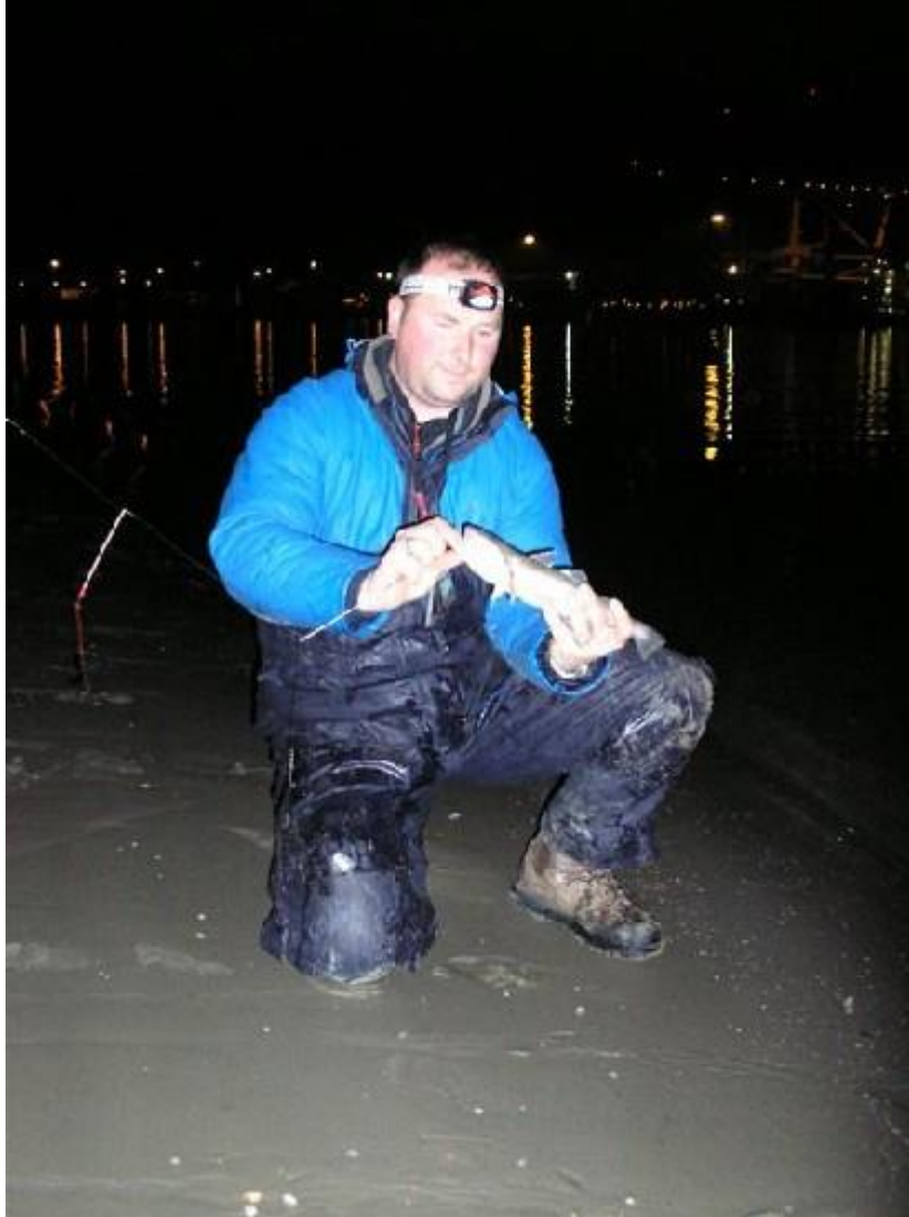
Gr Ricardo #119.