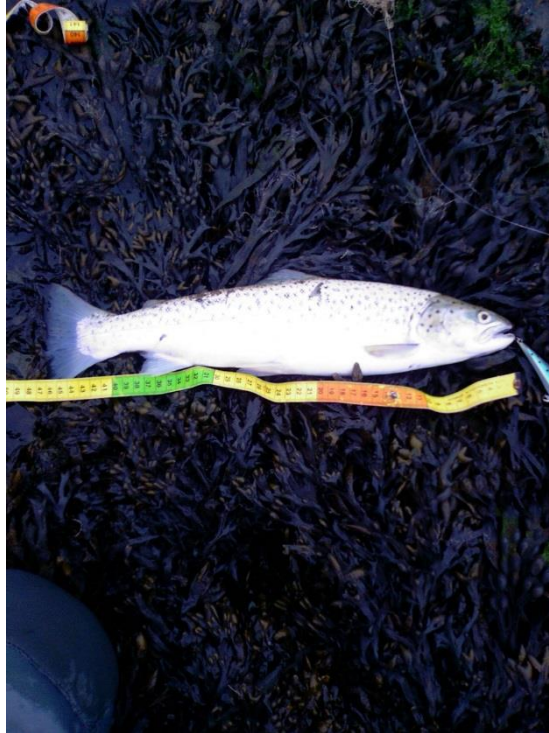
Groeten Chris & Roland

Vrijdag 1 september samen met Sjaak #2 naar de maasvlakte geweest voor de baars. Op de stek aangekomen, smiddags rond de klok van 4, leverde de eerste worp meteen een mooie baars op. Dat gaf de burger moed, en we gingen daar weg met 5 mooie baarzen van rond de halve meter (grootste 56cm) op de teller om op een andere stek het hoge water te gaan vissen. We hadden trouwens alles op de shad met een 14grams koppie gevangen. In de haven waar we stonden kwamen we Chris #1021 ook tegen, en met zijn 3en tot ff na 21.00 uur door staan gooien zonder ook maar een stootje beet. Kan je nagaan, vannochtend kwamen er op exact hetzelfde getij en plekkie bij een maat van me met een paar kornuiten nog 16 baarzen uit, nu niet eens beet !