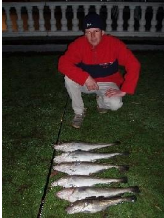
Gulle Groeten van de Zotten uit Beerse

De kleinste was een eindje in de 50 cm , de overige gullen lekkere 60 ers en voor de rest zeggen de foto's genoeg zeker !!!!!!!!!!!!!!!!!!!!!!!