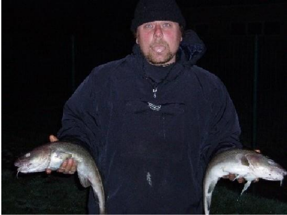
Groeten vanuit Beerse (van de Zotten natuurlijk)