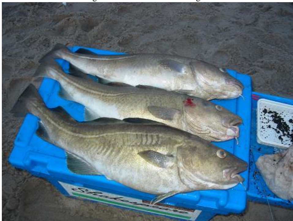
vangze Leo # 163

Na enkele aanbeten gemist te hebben lukte het 3 gullen binnen te halen.