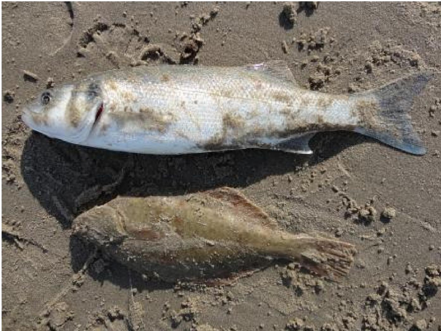
Vis greetz Willem#1168