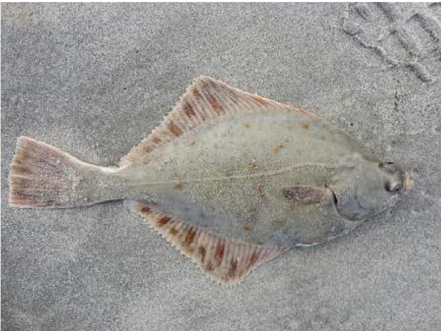
Vis greetz Willem#1168