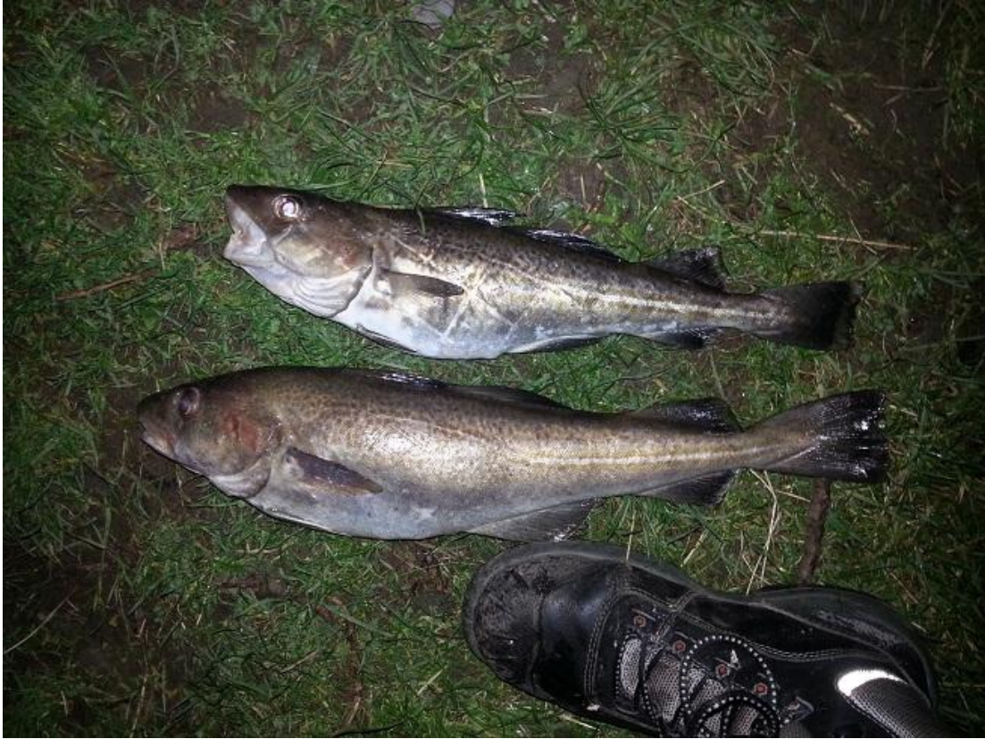
Groetjes Ayah Fouad.