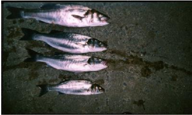
Groetjes Reggie #169.

In de nacht van 10/11 Augustus 2002 ben ik weer gaan vissen op de Pier van Hoek van Holland. Ik was natuurlijk overenthusiast van de vorige vangst. Het was best wel erg druk op de pier, ik had niet verwacht, dat zoveel mensen 's nachts vissen. Die nacht heb ik heel licht gevestig met kleine shads en jigkoppen van 15 gram. Ik had helaas geen grote, maar toch 4 mooie baarsjes. De grootste was 50 cm. en de kleinste was 35 cm.