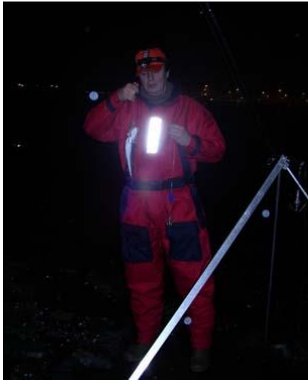
"De geest van Theo #48"

Het zal wel niet zo druk zijn zei ik om 15.00 uur aan de telefoon tegen Arjan #8 en vertrok richting Beerkanaal. Toen Arjan en Jan een uur later arriveerden was het echter wel mooi vol en kon ternauwernood nog een plekje worden veilig gesteld. Wat een (Euro)vissers waren er vandaag! En niet alleen aan het Beerkanaal maar overal leek het wel alsof de pieren volop verkrijgbaar en in de aanbieding waren en dat de vangsten, gelijk de Bijbelse 2 vissen, onbeperkt waren.