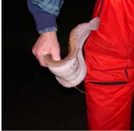
Het water kwam snel op en om 23.35 was de eerste Tong op de kant en een lap 44 cm.