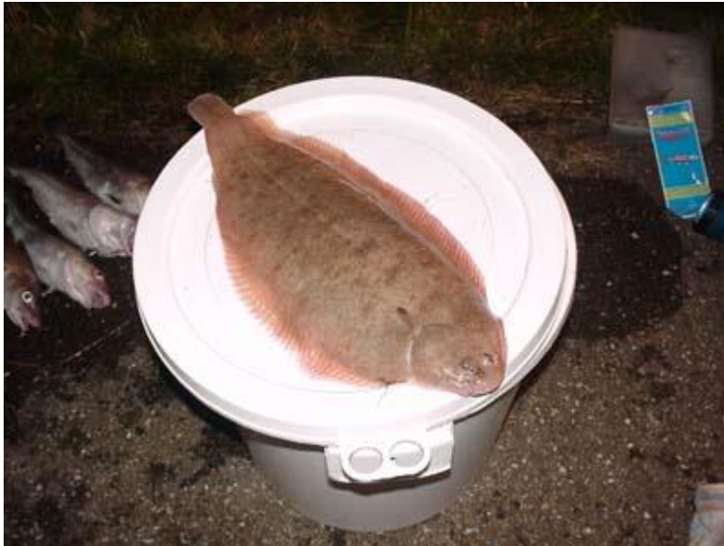
Gul na gul rukte aan de hengel met ook wat Bot en Bolkjes viel het reuze mee de vangst 23 gullen waarvan 18 boven de 40 cm ,