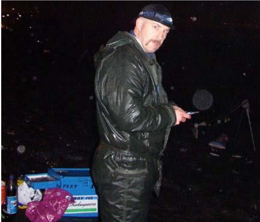
Door het slechte weer had het pak van #1,3 meer weg van een tampon gr Gilles #59

Ik had zelf zo'n 25 visjes waarvan 10 "dwerg"bolken. Om 23.00 uur vetrokken we weer richting huis vanaf de stek waar de geest van Theo voor Peet 1,3 toch weer een fikse gul in petto had, hetgeen door Arjan moeiteloos werd geaccepteerd.