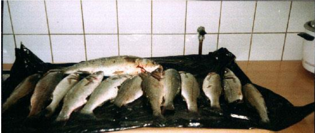
Groetjes, Reggie #169