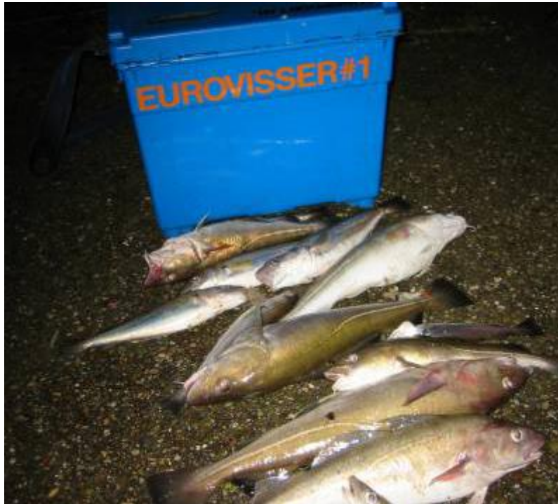
Leon #1,- 7 gullen en een zoi wijting, Peet #1.3,- 3 Gullen 16 wijtingen en een zoi steenbolken,