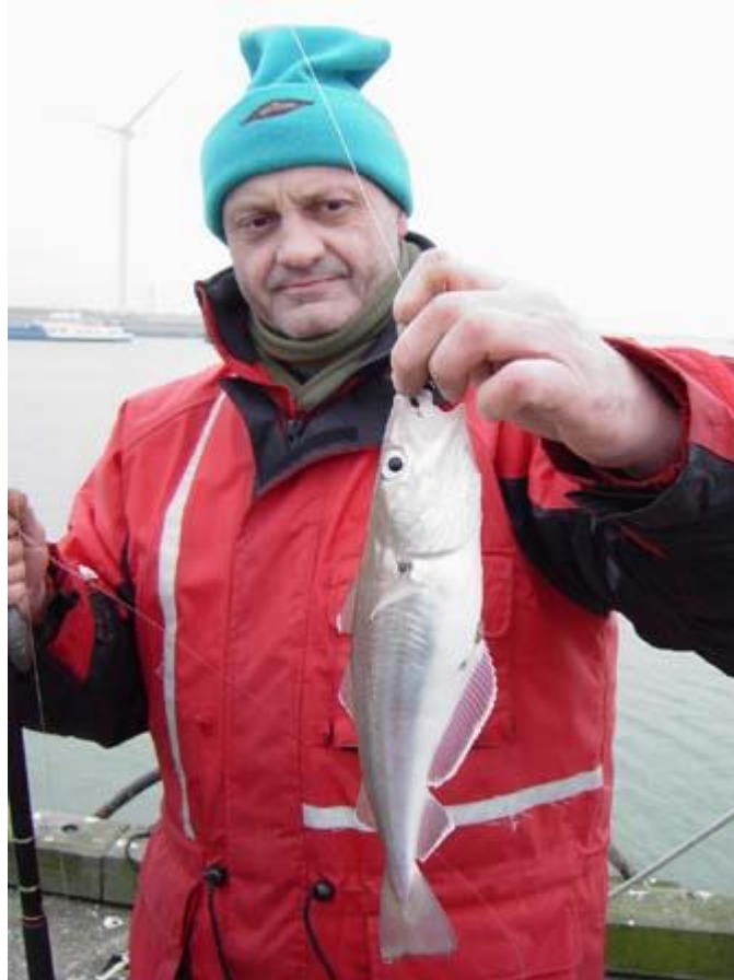
Strakke lijnen..... Stipo # 97