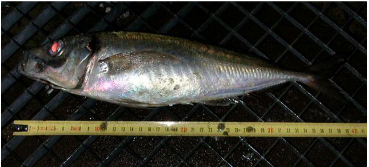
Willem nr 32

Er stonden al twee mannen en na een beetje gebabbeld te hebben over vissen begon het feest. 21 stuks (met drie man) en een fint en werd het toch nog een zeer geslaagde sessie. Èèn wil ik er nog aanmelden als eurovisser record, een Hors Makreel van 40 cm.