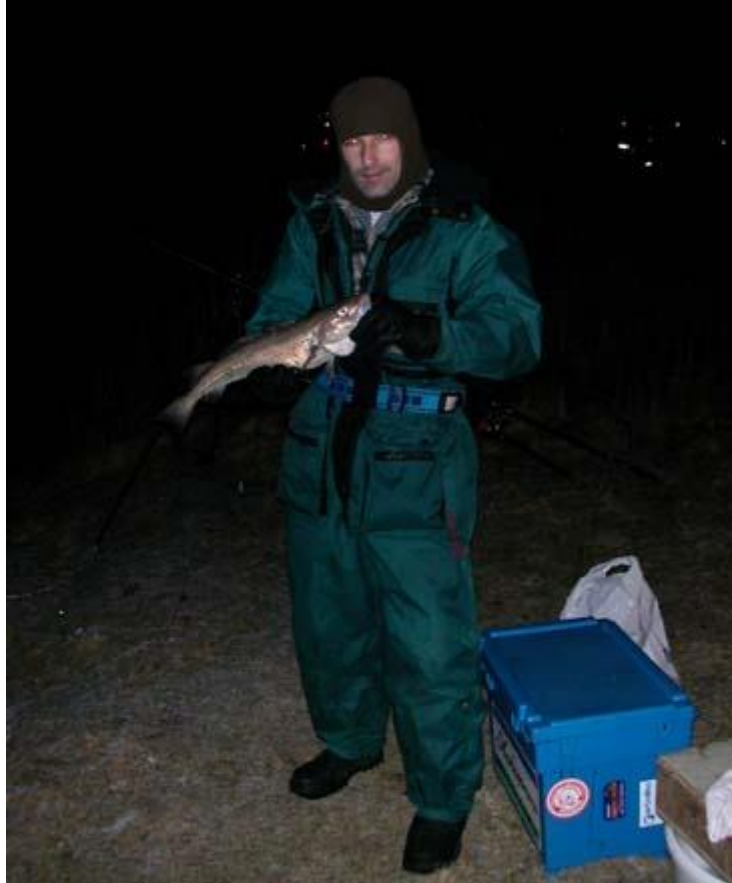
Het was dus weer een enerverend avondje comedy capers. Wilem nr:32

Op zaterdag 11 januari op de landtong gevestigd in de waterweg. Het was nagenoeg windstil, maar het vroom nog wel. Door de afwezigheid van wind was het niet moeilijk om zelf warm te blijven, maar de zagers en met name de pieren hadden daar meer moeite mee: na een uurtje begonnen ze erg stevig te worden. Het goede nieuws is dat de gullen los zijn: ik had er twee gevangen in drie uur tijd en één verspeeld. De mannen naast mij hadden er 3, respectievelijk 4.