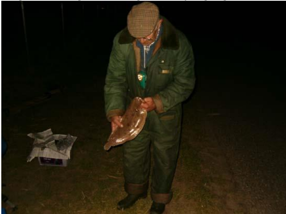
Gr John #99

Aangezien het alweer effe geleden was geweest dat ik de pieren leerde zwemmen, besloten om mijn overuren maar eens op te gaan maken aan de waterkant. Na aas gehaald te hebben, naar de Papagaaienbek gereden. Aangezien mijn ouweheer niet zo piep jong meer is besloten om daar ons geluk te proberen. Nou van 14.00 tot 18.00 was het niks en begon hij al te muiteren. Want vaak als hij mee gaat zijn de vangsten slecht of matig. Toen het donker werd, ging de beer pas echt los. Ik had het zweet dik op mijn kale plaat staan van het sjouwen met de hengels. Maar daar hoor je mij verder niet over. Een flinke klus wijting gevangen, mijn vader een mooie schol en als klap op de vuurpijl aan het einde van de sessie omstreeks 00.00 uur, ving hij nog drie tongen achter elkaar. Als het aan hem gelegen had dan had hij nog wel effe door willen vissen maar helaas was het aas op en moest ik nog 2 uurtjes tuffen. Al met Al toch nog een fijne dag gehad met een tong van 44,5 cm als grootste vis en jawel gevangen door hem.