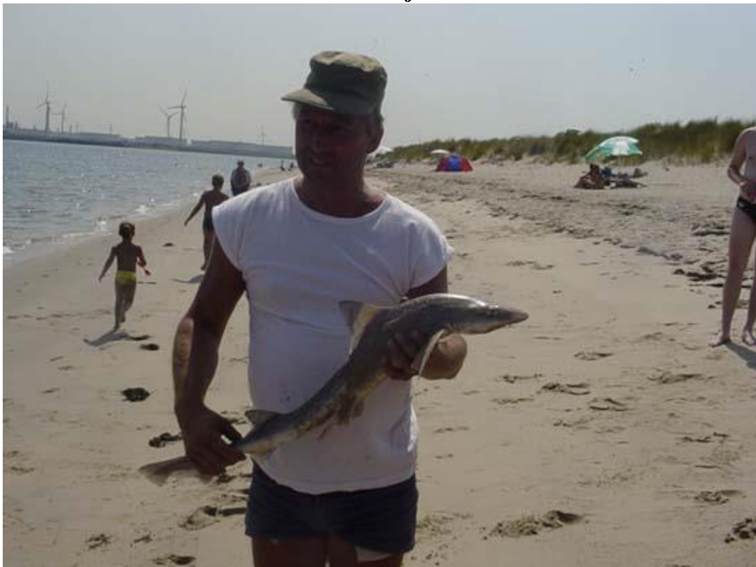
Toedeledokie Edwin #352

Dit vangstbericht is een klein beetje laat, maar ik kon niet eerder mailen. Deze haai, ik weet niet wat voor soort, heb ik gevangen op het strand van de maasvlakte op woensdag 13 augustus. Gewoon met een zager aan een dwarrellijn.