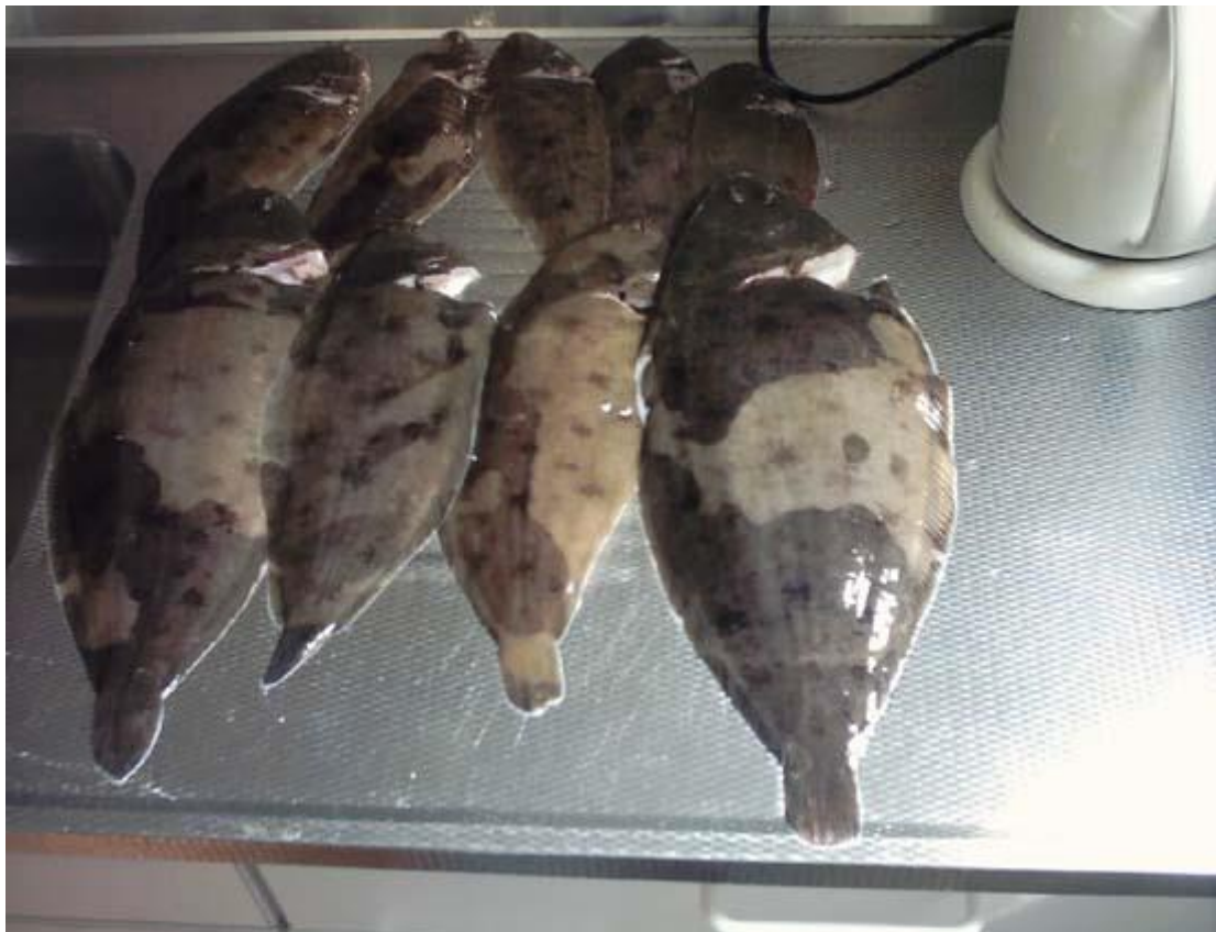
gr rob.s 419

edwin 1 tong glenn 2 tongen paul 4 mooie tongen en 5 botten ik zelf 7 tongen waarvan 2 ver boven de 40cm en 4 botten.