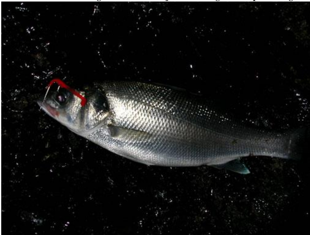
(40 cm) dus het was zeker niet schokkend. Willem NR 32

Nou van mij een berichtje dat al niet veel beter dan de andere. Vrijdagavond 1 aug, op mijn favoriete baarsstek geweest met als resultaat een versleten arm van het gooien en geen vissie te bekennen. Dan zaterdagavond maar weer proberen en dat ging al een stuk beter een stuk of 5 baarzen in de schemering aan een delta visje. Ik heb de grootste op de foto gezet