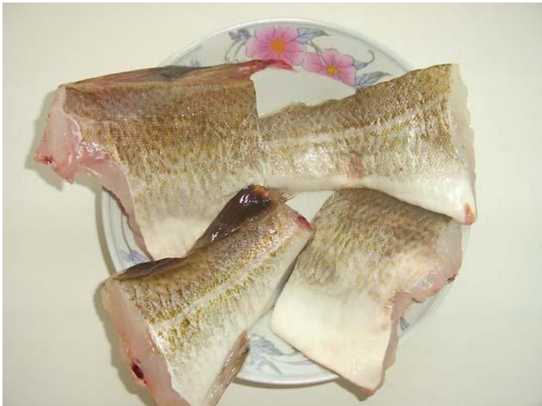
Dirk A. uit Wechelderzande

Vrijdag ,26/12 voor ongeveer de tiende keer vol goede moet vertrokken richting europoort om een gulletje te vangen.Gevist op de Rozenburgse landtong dicht bij de sluis.Slechts een visje gevangen na 7 uur vissen maar dan toch dit jaar nog een gulleke ±50cm. Pretige feesten en heel veel en grote vangsten gewenst aan al de collega vissers.Smakelijk eten ( Foto van een echte vissers feestmaal zelf gevangen en over heerlijk).