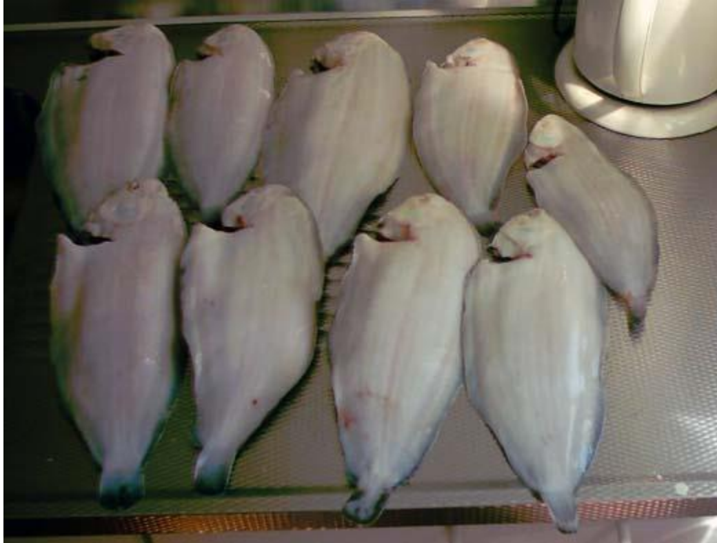
gr. rob s.

eergisteren, 9/7, wezen vissen in de waterweg gekozen voor diep water. wat resulteerde in een 9 tal mooie grote tongen allemaal boven de 35 cm. met diverse bijvangst zoals bot, paling, zeebaarsjes. gisteravond nog eens geprobeerd met het aas van de vorige dag wat we over hadden en deze keer zijn we in ondiep water gegaan, voorbij de kering en toen hadden we toch ook nog 10 tongetjes, waarvan 2 boven de 30 cm en wat baarsjes en botjes en 1 paling, de vangsten waren aanzienlijk kleiner dan in dieper water. en het weer zat gelukkig ook mee dus leuke visavonden gehad zo.