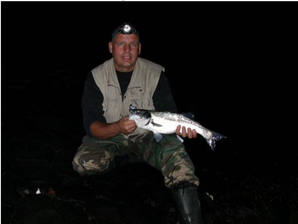
Vangzu Willem nr32

Ze waren niet heel erg groot maar doken op het kunstaas alsof ze niets te eten hebben daar onder water, alles zwemt weer, hebben we er volgend jaar weer wat aan. Vrijdag ga ik naar een (zeebaars) wereldstek volgens de kenners, het is wel een stukje rijden maar dat moet dan maar. Ik geloof dat het in de buurt van Lobith is.