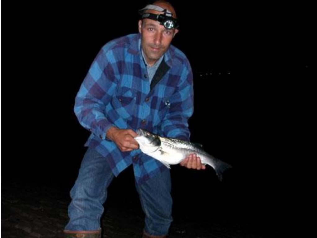
Willem nr 32 en hans nr 262