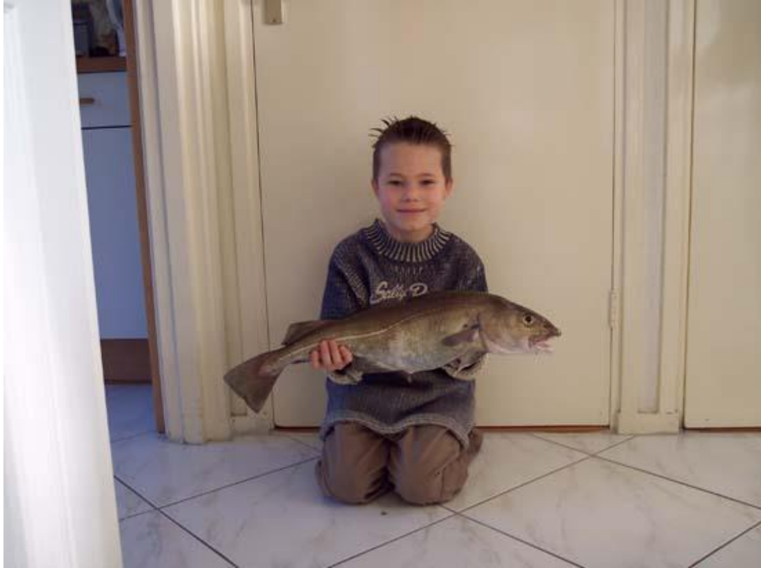
gr hans #262

gevist zonder willem die lag met griep in bed.