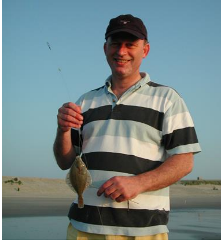
Hierbij war sociale fotootjes. See Yoy!! Tuur #77

Leon, ik las je vangstbericht van 1 juni. Wij (drie man) hebben van vrijdag 15.00 tot zaterdag 03.00 gevist bij de pap.bek. bij het grote parkeerterrein in de bocht. 's-Middags viel de vangst wat tegen (een botje). Wat opviel was dat er miljoenen blijkjes vlak langs de kant zwommen. Het zag echt zwart van de blijk. Vanaf 19.00 kwamen de finten jagen. Ze waren zo gek, dat ze zelfs boven water uitsprongen. Vaak zelfs 3 tot 5 meter uit de kant. Als er even geen beweging was in het water, dan gaven de meeuwen wel aan waar het spul zat. Spinhengel gepakt, langzaam zinkende bombetta, twee meter lijn en een groene Slug-go van 5 cm. Tussen de springende blijk gegooid en achter elkaar raak. Helaas zat er geen zeebaars tussen, maar het is mooie sport. Volgende keer toch maar eens proberen met de vliegengel. Na donker geen fint meer te zien. Het was ineens afgelopen. Verder met de strandhengel. Nog een paar botjes, palinkje en zeebolkje gevangen. Al met al een lekker visdagje.