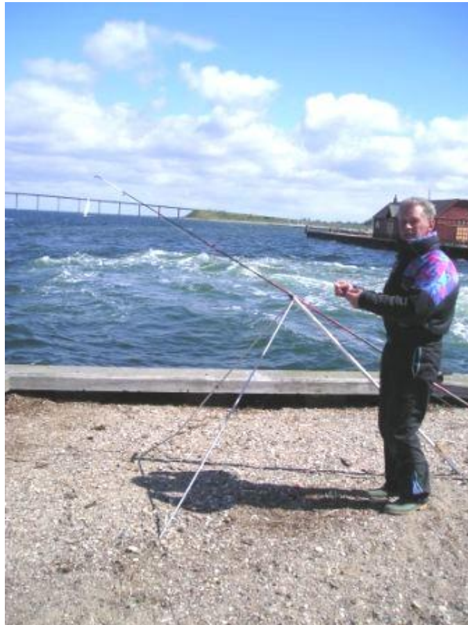
Jan bij ruig water