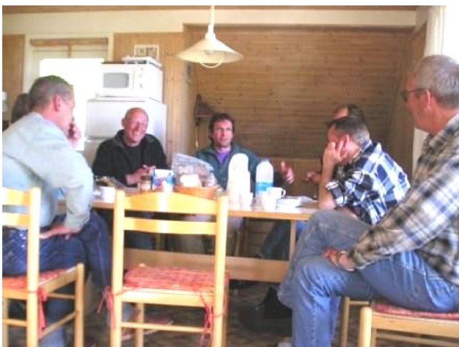
Gezellig binnen aan het wachten op rustig weer.

Woensdag is hetzelfde laken een pak en opnieuw moet er worden overgegaan tot het vangen van platvis. We proberen verschillende technieken en dieptes en uiteindelijk is het de weegschaal op een meter of 9 water dat het meeste succes heeft. Een paar grote botten, scharren en enkele schollen komen uit het water. Door