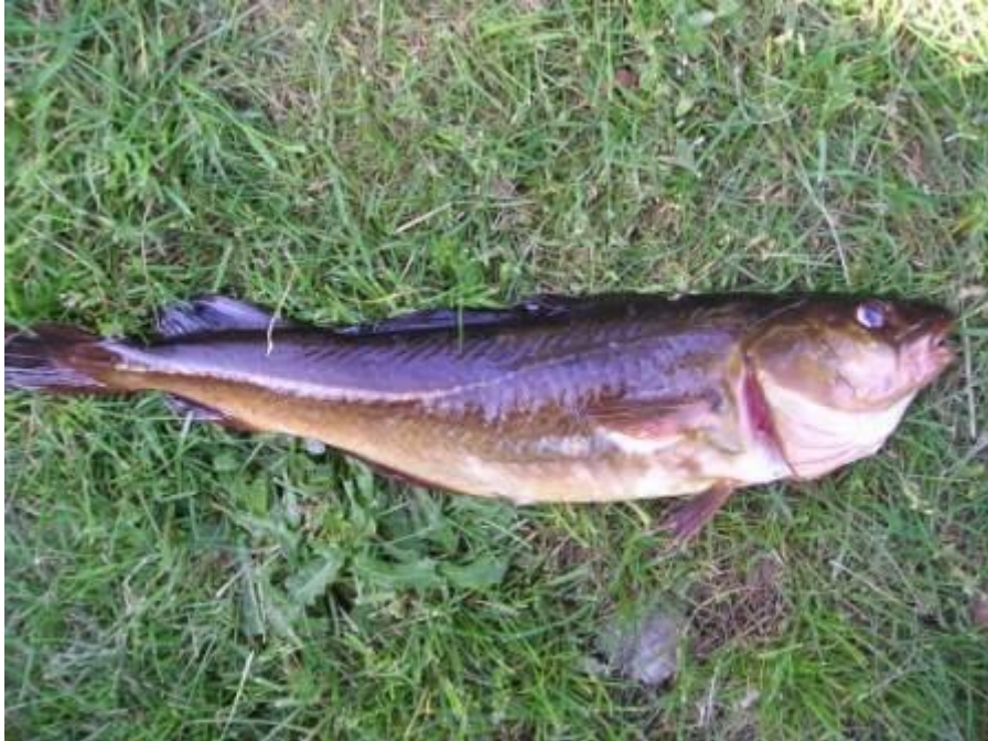
Dit zijn de vissen die we zoeken en vinden.

de wind en de harde bodem gaat het anker krabben en we moeten weer verkassen. Noodlot hadden we niet genoeg deze dagen want tijdens het varen verliezen we het anker. Dat gaat van de vistijd af, want de botenboer is toch zo'n 15 kilometer verderop. Terugvaren dus en met de auto heen en weer. Aan het einde van de dag toch met z'n allen een leuk aantal mooie scharren.