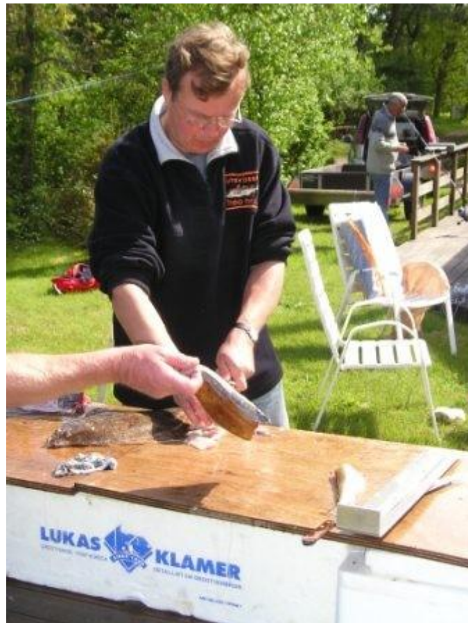
Theo : die gaan we fileren