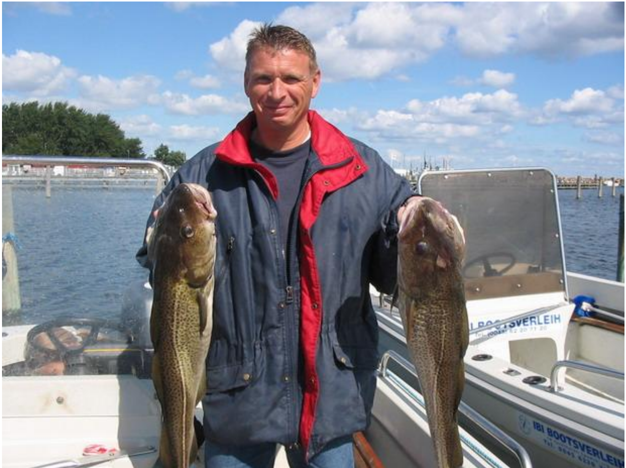
Vrijdag: Heel even met de boot weg geweest en een aantal kleintjes gevangen (zwemmen weer)