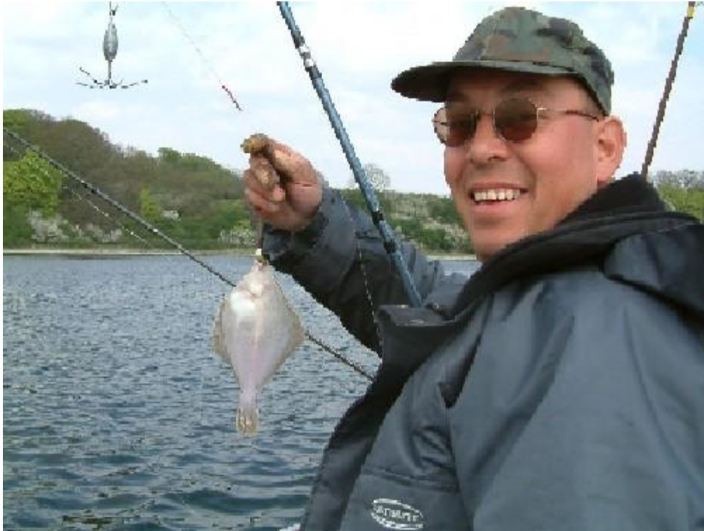
Donderdag 29 April.

Het weer was perfect en we hebben dan ook meteen na het uitpakken van de spullen de BQ aan gemaakt.Na het eten toen het wat donker was nog even naar de steiger geweest, maar helaas geen gullen en alleen torren.