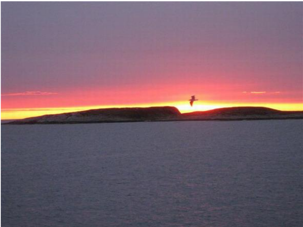
De eerste echte visdag

We waren natuurlijk allemaal zeer moe en er werd die dag dan ook niet meer gevist. Nadat wij hadden genoten van een heerlijk Indisch gerecht, voorgezet door onze meegereisde kok, Wim, werd er gezellig geborreld. We kregen daarbij nog gezelschap van een Fin die in een van de andere huisjes verbleef. Ook Rune kwam nog even gezellig bij ons zitten. Hij liet die avond ook nog 'Per' opdraven, een dorpsgenoot die ons een keer op zijn charterboot mee kunnen nemen. Ook Per bleek een en al vriendelijkheid en deed lekker een biertje mee.