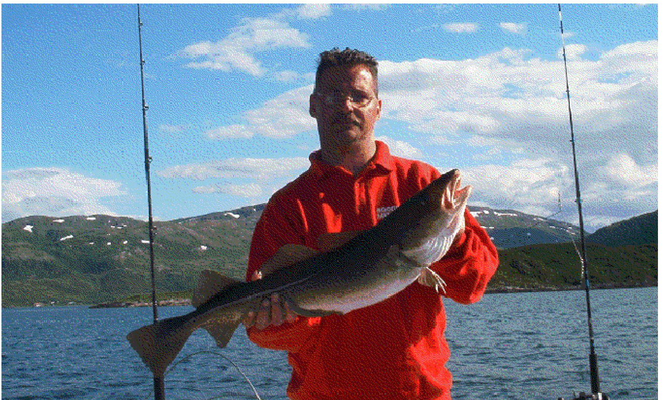
Eerst visten we met visstrips, maar al snel met een hele Koolvis-filet.