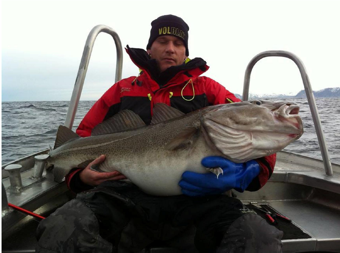
22 kg zware Noorse schone

Me 2e vis was er een van 22kg en een half uurtje later kwam er een boven van 21kg de vis waar ik eigenlijk voor ging:).