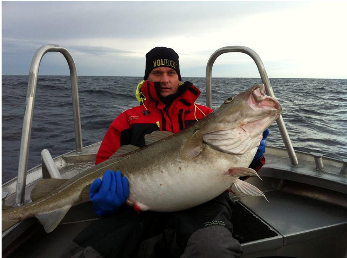
31,5 kg zware Noorse Supervis