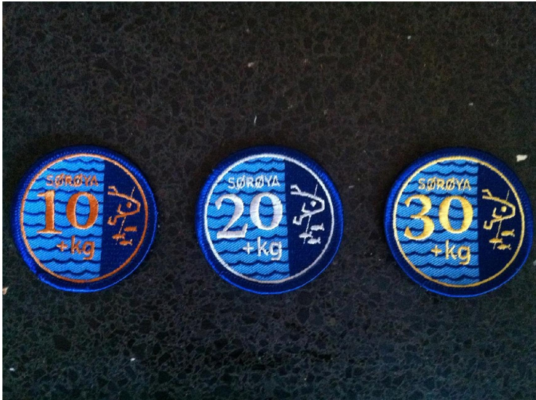
Felbegeerde en wel verdiende Badges

ge Volgend jaar maart ga ik weer naar Sørøya toe om te kijken of ik me pr wat scherper kan stellen.