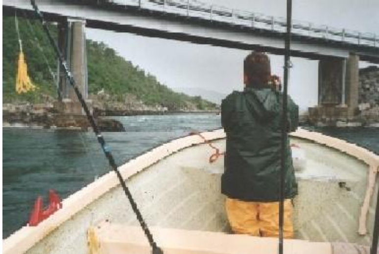
Hengelen als in zoetwater.

We vingen hoofdzakelijk wat gullen en pollakken van \pm 4 kilo, met uitschieters naar boven en beneden. Geregeld hing de paternoster vol met kleinere koolvis, die overal massaal aanwezig was. Via de dieptemeter zochten we onderwaterheuvels op en lieten ons met de wind bergaf driften.